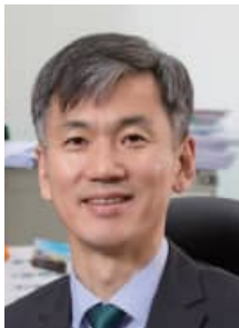
서울대학교 행정대학원 주임교수

최고위과정으로 102기를 맞이한다는 점은 그 자체로도 대단한 일이지만 동시에 과정을 운영하는 서울대학교 행정대학원에게도 막중한 책임을 부여하는 것이 사실입니다. 여러분들의 적극적인 참여 만큼 학교에서도 최선의 노력을 다하도록 하겠습니다. 감사합니다.