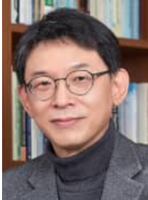
서울대학교 행정대학원 원장